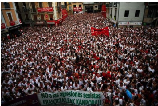
Manifestación de rechazo a la violación en San Fermin, en Pamplona.

Madrid - Martes, 04/06/2019 | Actualizada 05/06/2019 - 17:04