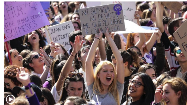
Un motivo más para la violencia machista.