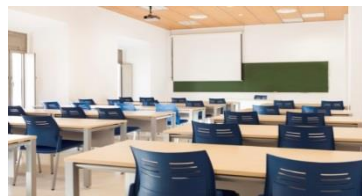
C/ Compañía del V. 11, s/n 51001 Centa