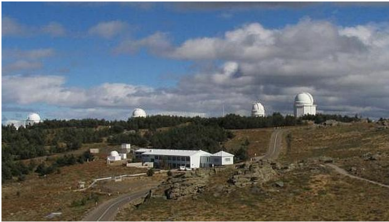
Observación en Calar Alto