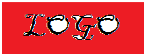
Figura 4.1: Mi logo

Se deben evitar imágenes “por poner” 1 , como la Figura 4.1. Que es un logotipo.