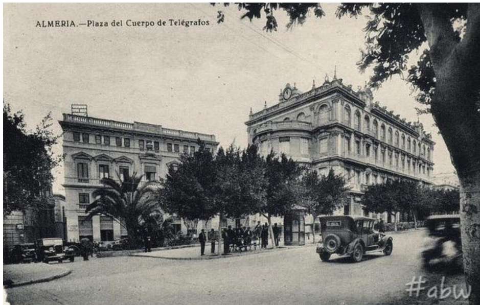
Imagen de la primera sede de Correos y Telégrafos de los años 30 del siglo XX