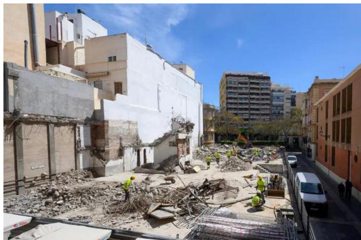
Imágenes de mayo del 2024 de la parcela vacía objeto del proyecto.