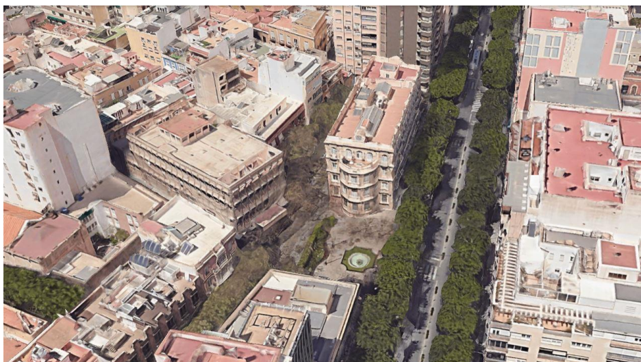
Imagen aérea de la segunda sede de Correos y Telégrafos antes de su demolición en 2024