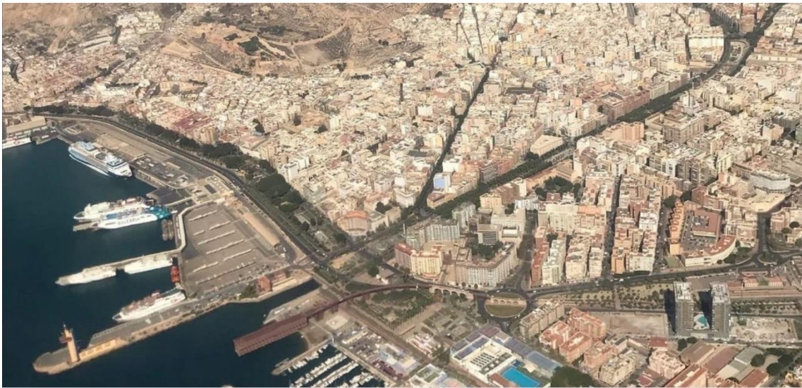
Vista aérea actual de Almería

Se plantea la reflexión contemporánea en relación a la actividad cultural surgida en las redes, apostando por la creación de un laboratorio ciudadano en donde se potencie la investigación, la producción y la difusión. Aprovechando la oportunidad del derribo del antiguo edificio de correos en el centro de Almería y la polémica surgida en la ciudad que deja como lugar de oportunidad a dicho solar, se pretende crear en el corazón almeriense, un lugar dedicado a la cultura digital y a la producción de proyectos multidisciplinares de concienciación social. De esta forma, con esta intervención arquitectónica y urbana se pretende dar respuesta a la ciudad y al ciudadano de cualquier edad generando proyectos asociados a un laboratorio de innovación social con una metodología abierta y colaborativa.