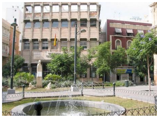
Imagen de la segunda sede de Correos y Telégrafos antes de su demolición en 2024