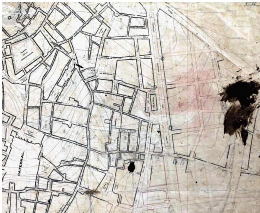
Plano de Pérez de Rozas de Almería de 1864