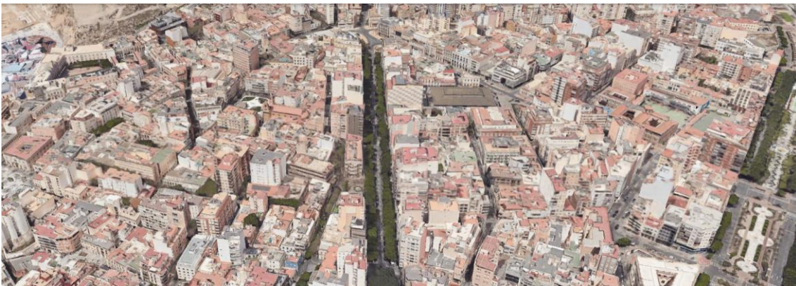
Vista aérea del eje del Paseo de Almería