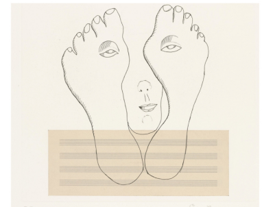
Metamorfosis (1999). Louis Bungeis.

Viernes, 11 marzo 2022 18:30 - A3 - ETSAG