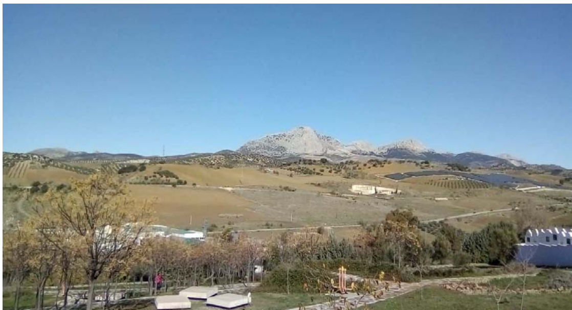
Situación y vista de entorno próximo del proyecto 1