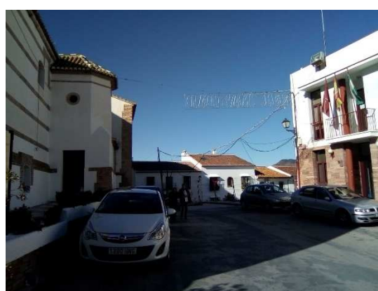
Entornos de los proyectos 1 y 2