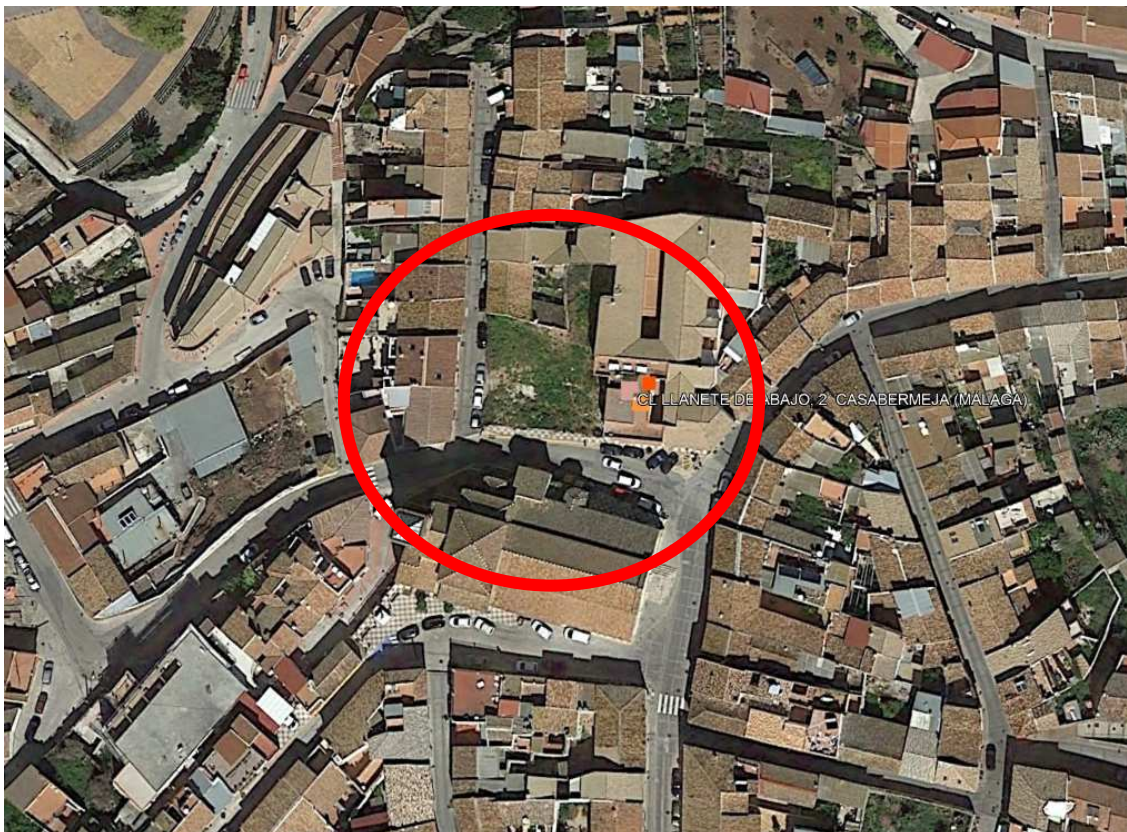
Situación y entorno urbano del proyecto 2