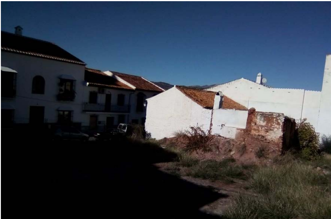
Solar y entorno urbano del proyecto 2